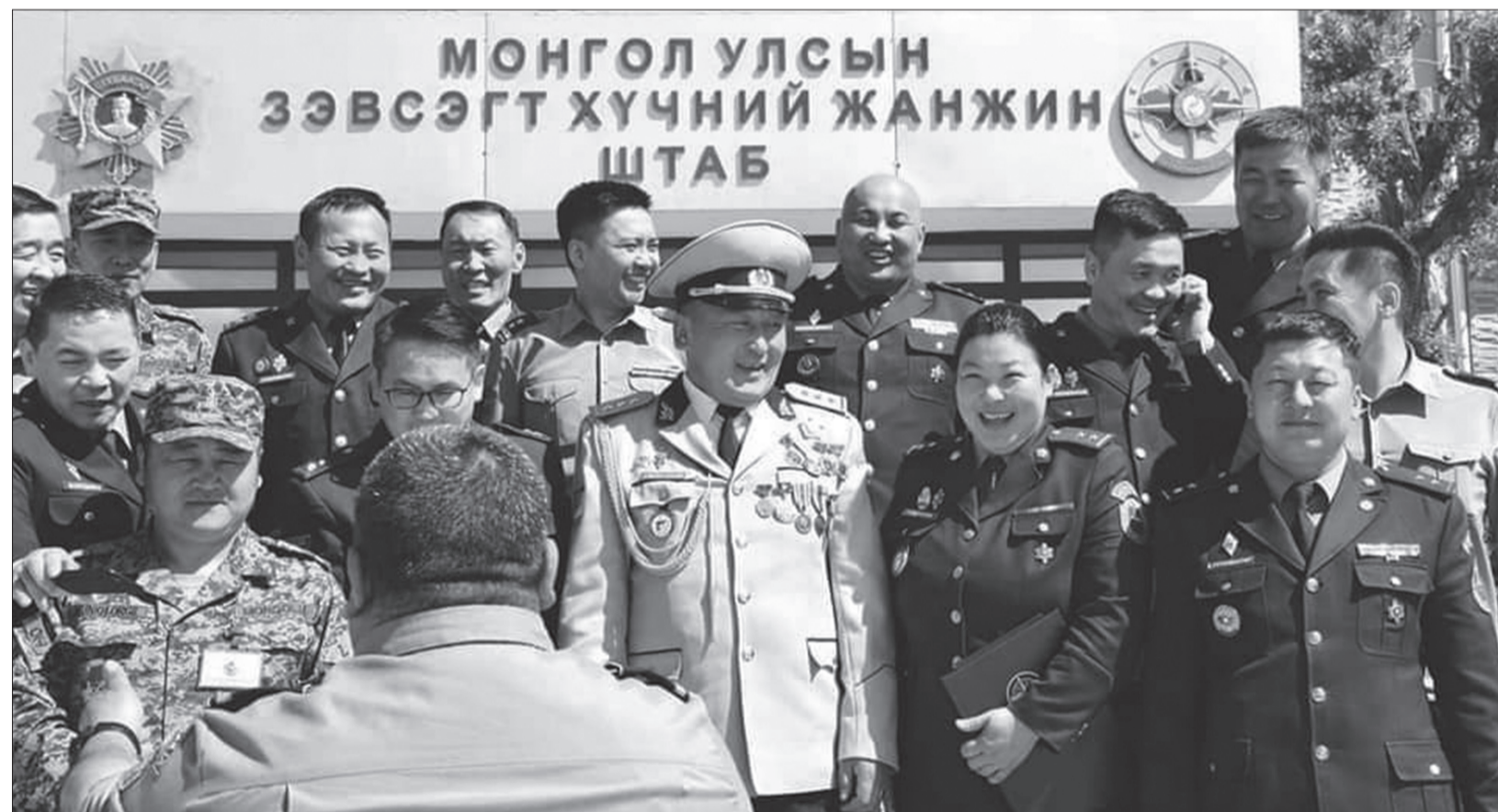
Насаараа бид нэг ангийнхан

-Бодоод байсан, эмэгтэйчүүдийн баяр гэхээсээ илүүтэй цэргийн баяраараа эрчүүдтэйгээ хамт баярлачихдаг юм байна. Гэхдээ хамт олон минь юу гэж зүгээр байх вэ. Хэзээд