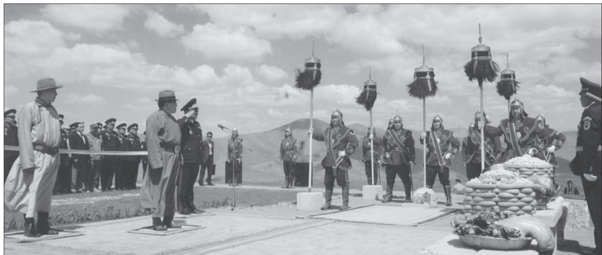
Бүх цэргийн Их хар сүлдийг цэнгүүлэх ёслол. 2011 он