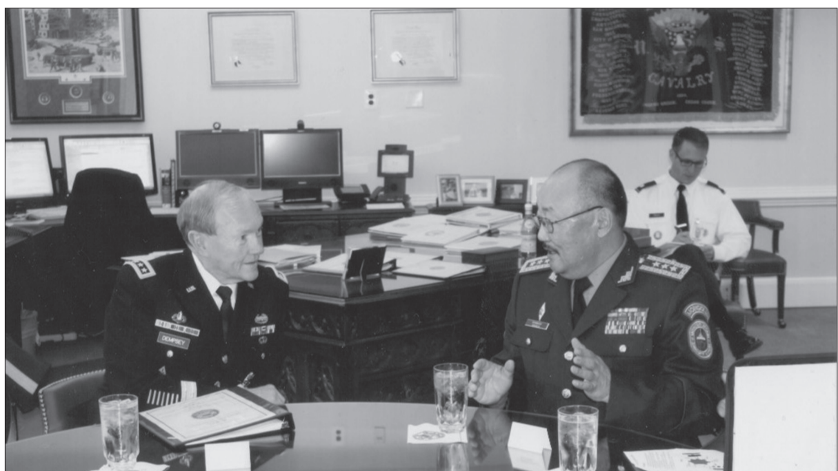
АНУ-ын Штабын дарга нарын нэгдсэн хорооны дарга, генерал Х.Дэмпсийн хамт

нэлээд анхаарал хандуулсан. Юуны өмнө Зэвсэгт хүчний удирдах бүрэлдэхүүн болон анги, байгууллага, нэгжийн дарга, захирагч нартай илэн далангүй ярилцаж ойлголцохыг хичээсэн. Шударга ёсыг эрхэмлэх, харилцан итгэлцэх, ойлголцох, дэмжих гэсэн дөрвөн зарчмыг баримталж ажилласан. Зэвсэгт хүчнийг мэргэжлийн чиг баримжаатай, чадварлаг болгон хөгжүүлэхийн тулд офицер, ахлагч нарын боловсролын түвшин, үүрэг гүйцэтгэх чадвар, бие бялдрын хөгжил, ёс суртахууны төлөвшил зэрэг асуудлуудад шалгуур тавьж, сургаж бэлтгэхийг зорьсон.