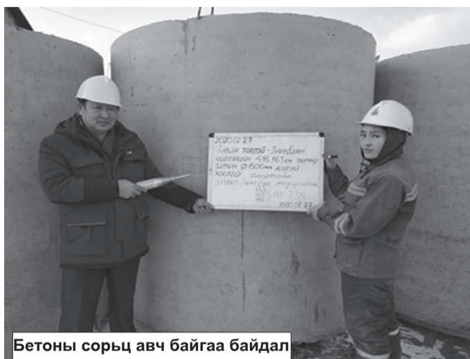
Бетоны сорьц авч байгаа байдал