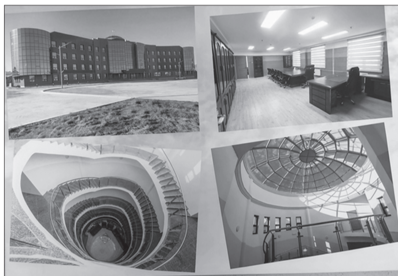
Хуурай замын цэргийн командлалын шинэ байр