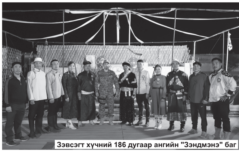
Зэвсэгт хүчний 186 дугаар ангийн "Зэндмэнэ" баг