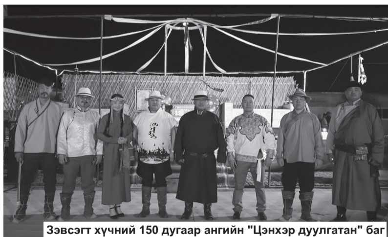
Зэвсэгт хүчний 150 дугаар ангийн "Цэнхэр дуулгатан" баг

Тэгвэл тэмцээний ялагч Зэвсэгт хүчний 150 дугаар ангийн "Цэнхэр дуулгатан" багийн дайчид Монгол Улсынхаа их түүхийн шаргал хуудсыг эргэн сөхөж, өвөг дээдэс минь цаг хугацаа, орон зайн ямар ч нөхцөлд тусгаар тогтнолын баталгаа болсон үндэсний уламжлалт Сар шинийн баяраа хэрхэн өвлөн тээж, өртөөлөн ирснийг түүхчлэн харуулж, үзэгчдийн сэтгэлийг огшоон,