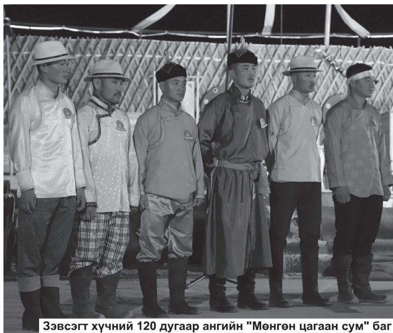
Зэвсэгт хүчний 120 дугаар ангийн "Мөнгөн цагаан сум" баг