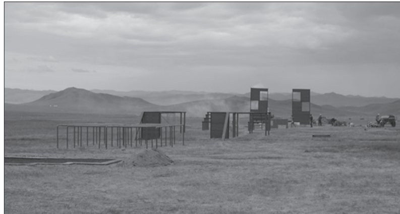
Зэвсэгт хүчний Сургалтын нэгдсэн төвд байрлах "Аравт" олон улсын морин цэргийн уралдаанд зориулсан саадын зурвас