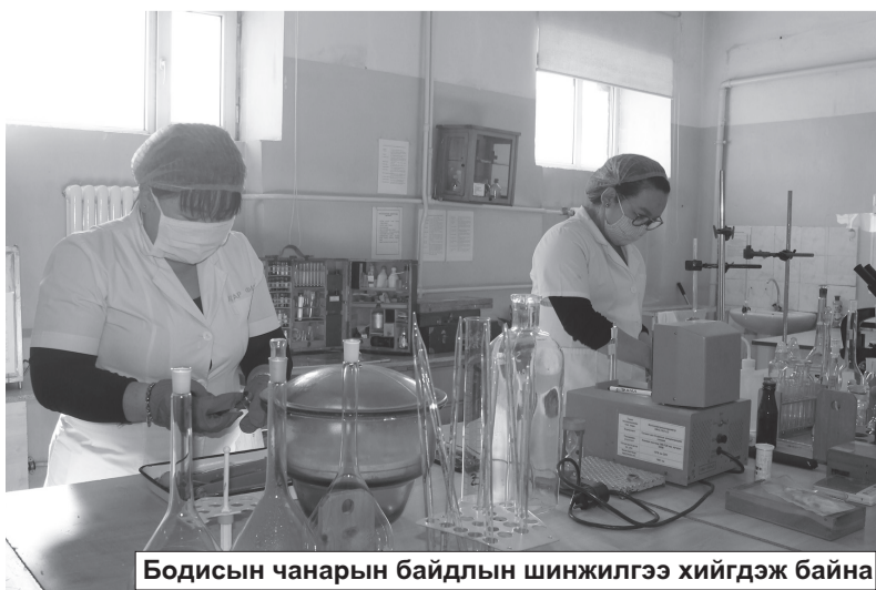
Бодисын чанарын байдлын шинжилгээ хийгдэж байна