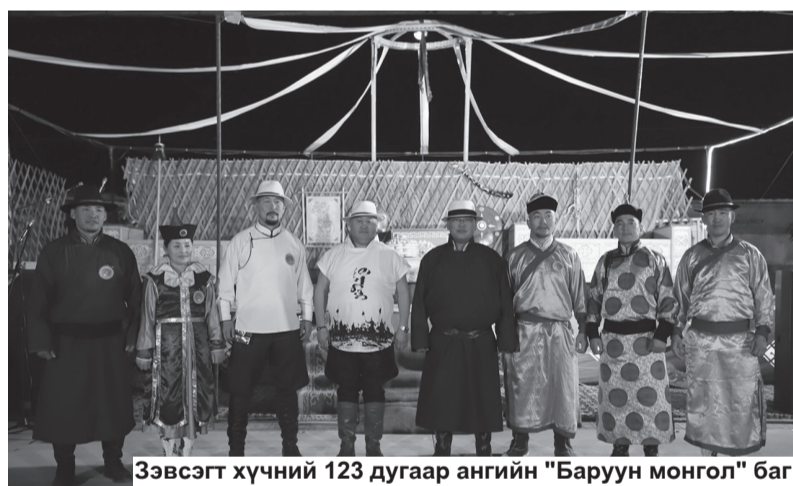
Зэвсэгт хүчний 123 дугаар ангийн "Баруун монгол" баг

бахархлыг төрүүлээд амжсан юм. Зэвсэгт хүчний 084 дүгээр ангийн шүхэрчин дайчид буюу "Наадгай" багийнхан ч ялгаагүй өнгөрсөн, одоо, ирээдүй гурван цагийн хэлхээс, газар, тэнгэрийн шүтэлцээ холбоог өөрсдийн мэргэжлийн онцлогтой уялдуулан мэндчилсэн. Товчхондоо шигшээ багууд үнэхээр шилдэг байж үзэгчид, шүүгчдийн сэтгэлийг хөдөлгөсөн, өв уламжлал хөвөрсөн үзүүлбэрүүдээр битүүний бэлгэт оройг хөглөж чадав.