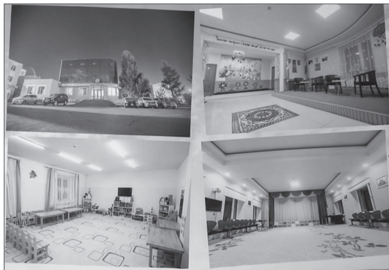
Батлан хамгаалах яамны дэргэдэх 120 хүүхдийн "Цоглог" цэцэрлэгийн байр