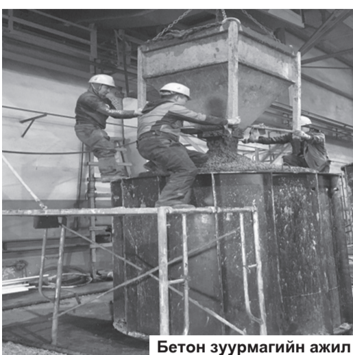
Бетон зуурмагийн ажил

Шинэ бүхэн хуучнаа халж, ирж буй болгон ирээдүйн сайн сайхан бүхнийг даллан дуудах нь энэ орчлонгийн эргэх жам. Цаг хугацаа гэж хэнд ч үл захирагдах "их эзэн хаан" улирсан бүхнийг ардаа үүрч, утгсан бүхнийг урдаа тэвэрч угтах. Эл цагийн урсгал дунд элж мартагдах зүйл олон ч элж мартагдах нь бүү хэл эхэлж, өрнөж, өөдөлж дэвшиж, өргөжиж тэлсэн үйл арвин.