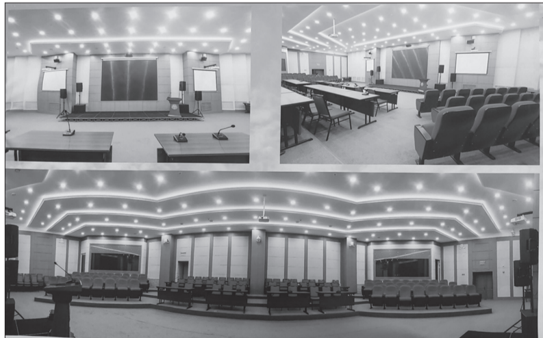
ҮБХИС-ийн олон улсын хурлын заал