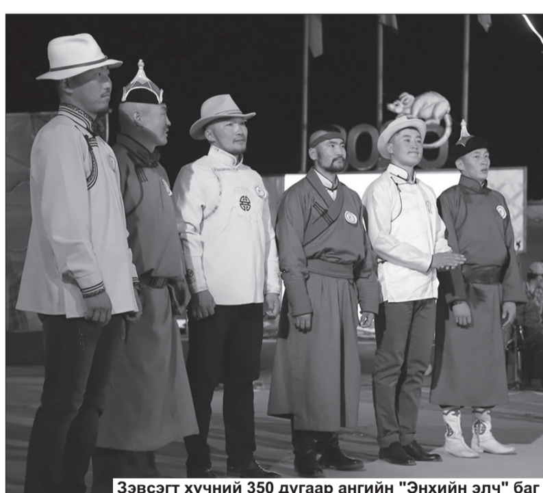
Зэвсэгт хүчний 350 дугаар ангийн "Энхийн элч" баг