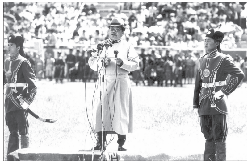
1990 оны наадмын нээлт

Үндсэн хуулийн зүйл, заалтын дагуу 1992 оны 4 дүгээр сарын 28-ны өдөр "Монгол Улсын Бүх цэргийн