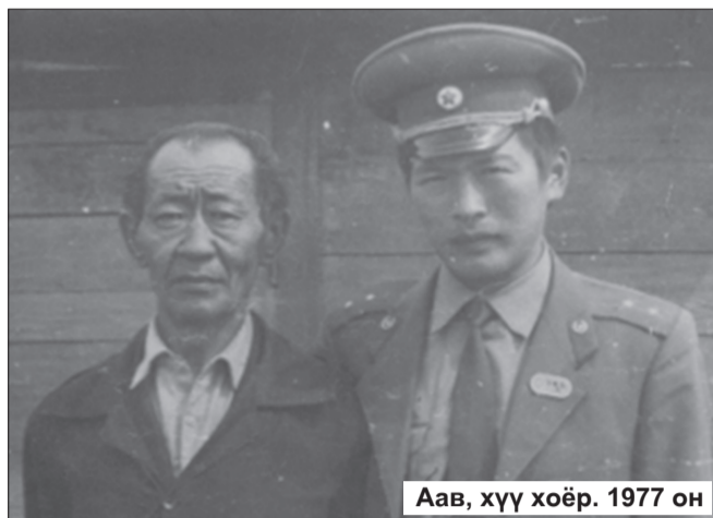
Аав, хүү хоёр. 1977 он