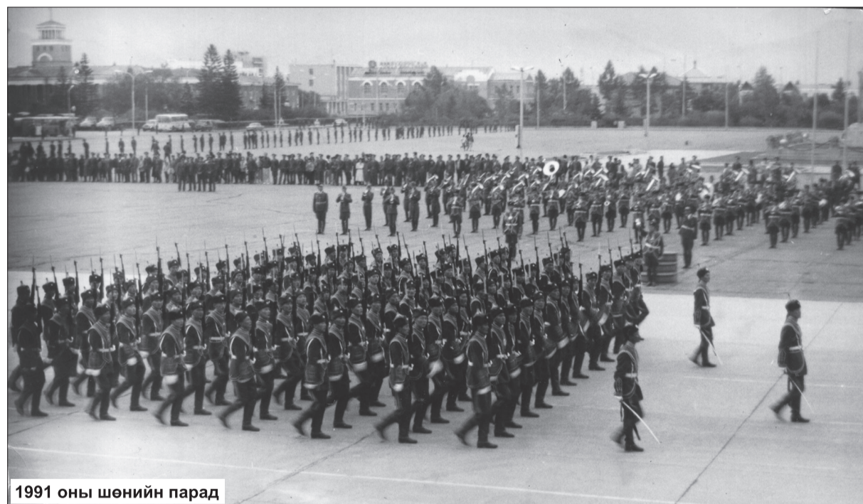
1991 оны шөнийн парад

гүйцэтгүүлсэн юм" гэж БХЯ-ны сайд агсан хурандаа генерал Ж.Ёндон дурсан бичиж үлдээсэн байна.