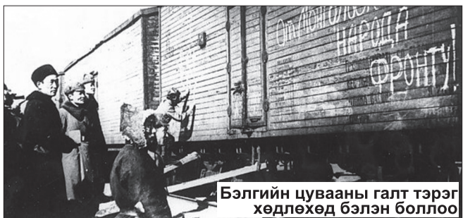
Бэлгийн цувааны галт тэрэг хөдлөхөд бэлэн боллоо

Улаан армид зориулан Монголын ард түмний хуримтлуулсан бэлгийн анхны цувааг Октябрийн хувьсгалын 24 жилийн ойг тохиолдуулан 1941 оны 11 дүгээр сард илгээжээ. Түүнд багтсан зүйлийг Аж үйлдвэрийн комбинат, үйлдвэр, хоршооллын ажилчид 1941 оны төлөвлөгөөнөөс гадуур, илүү цагаар буюу ням гараг, ээлжийн амралтаараа ажиллан бүтээсэн бөгөөд нийт 15000 цэргийг хувцаслах нэхий дээл, эсгий гутал,