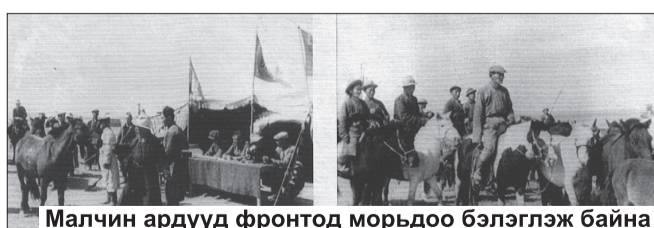
Малчин ардууд фронтод морьдоо бэлэглэж байна

Эх орны дайны фронтоос 6-7 мянган километр алслагдсан гүн ар талд Монголын ард түмэн бүхий л бололцоогоо дайчлан хөдөлмөрлөж, Зөвлөлтийн Улаан армид туслах олон хэлбэрийн ажлыг өрнүүлсний дүнд нийтдээ 435 сая төгрөгийг үнэ бүхий хувцас, хүнс, эд материалын зүйл ба 300 орчим кг алтыг биетээр өгсний зэрэгцээ Зөвлөлтийн Улаан армид үзүүлсэн томоохон тусламж нь агт морьд нийлүүлсэн явдал байлаа. Дайн эхлэхэд Улаан арми 526,4 мянган морьтой, 1941 оны 9