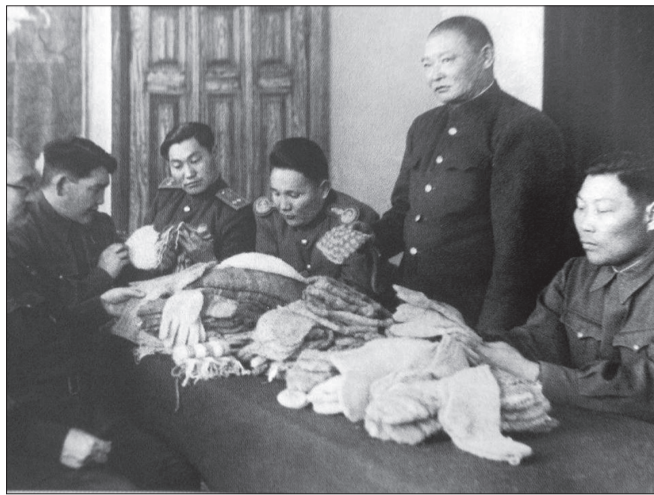
Төр, засгийн удирдагчид бэлгийн бараатай танилцаж байгаа нь

үстэй бээлий, нэхий хантааз, цэрэг бүс, 6000 ширхэг ноосон цамц, 440 нэхий хөнжил зэргийг илгээжээ. Энэ нь тухайн үеийн ханшаар 1,813,515 төгрөгийн үнэ бүхий зүйл байсны зэрэгцээ бэлнээр 587,000 төгрөгийг Зөвлөлтийн "Улсын банк"-д шилжүүлжээ.