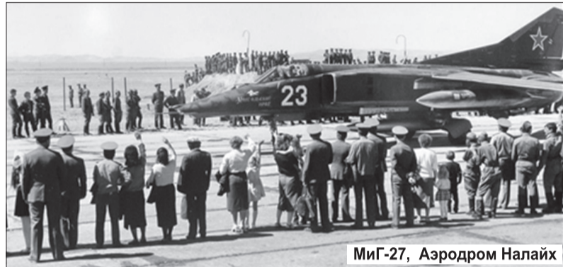
МиГ-27, Аэродром Налайх