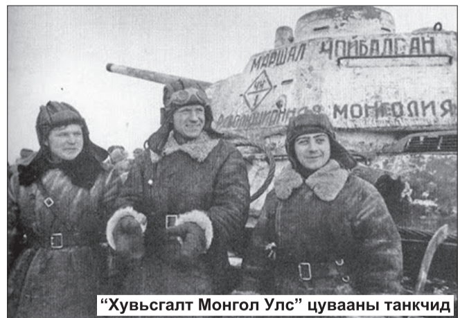
“Хувьсгалт Монгол Улс” цувааны танкчид

“Хувьсгалт Монгол Улс” гвардын танкийн 44 дүгээр бригад нь Москвагийн дэргэдээс аян дайны түүхэн замналаа эхэлж, Берлиний ерөнхий давшилтад оролцож байлдааны үүргээ гарамгай биелүүлсний учир