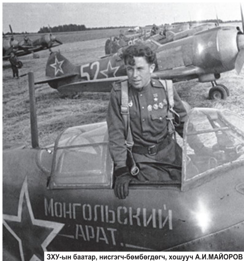
ЗХУ-ын баатар, нисгэгч-бөмбөгдөгч, хошууч А.И.МАЙОРОВ

Дашрамд дурдахад, БНМАУ-ын нэрэмжит 266 дугаар нисэхийн сөнөөгч-бөмбөгдөгч хорооны 4 дүгээр эскадриль буюу МАА-ийн сөнөөгч онгоцны 1 дүгээр эскадриль нэртэйгээр МиГ-15, МиГ-17 онгоцтойгоор 1970 онд