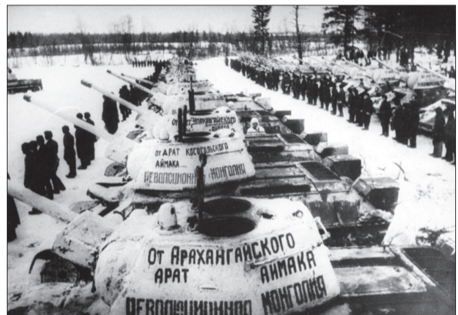
“Хувьсгалт Монгол Улс” танкийн цувааг хүлээлгэн өгч байна

Энэ бүхний үндсэн дээр танкийн бригадыг ЗХУ-д үйлдвэрлэсэн “Т-34”, “Т-70” загварын 53 танкаар бүрдүүлэн байгуулж, 1943 оны 1 дүгээр сарын 12-ны өдөр Москвагаас холгүй орших танкийн 112 дугаар