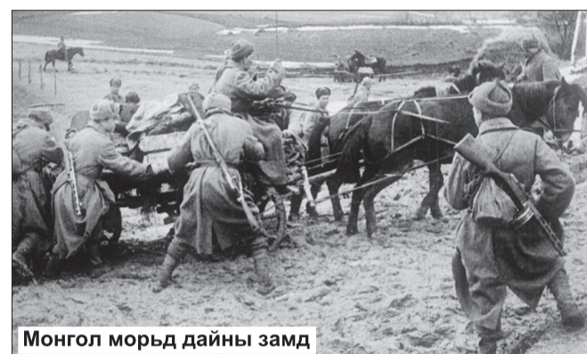
Монгол морьд дайны замд

МАХН-ын Төв хороо, БНМАУ-ын Сайд нарын Зөвлөл 1942 оны 3 дугаар сарын 31-ний өдөр Малчдаас агт морьд тогтоосон үнээр худалдаж авах тухай тогтоол гаргаж, малчин ардуудыг фронтод морь нийлүүлэх, бэлэглэхийг уриалан “Шилдэг морьдоо фронтод” хөдөлгөөнийг өрнүүлжээ. Үүний дагуу морь бэлэглэх ажил өрнөж адуутай нь шилмэл морьдоо өгч, адуугүй нь бусдаасаа худалдан авч бэлэглэж байжээ. Аймгуудад агт авах байрыг Дорнодод-3, Хэнтийд-4, Төвд-5, Завханд-2, бүгд 14 газар байгуулснаар зарим жил нь зудтай байсан ч энэ ажил орон даяар идэвхтэй үргэлжилж 1942 онд 215 сум, 1943 онд 183 сум, 1944 онд 202 сум агт нийлүүлэх төлөвлөгөөгөө бүрэн биелүүлжээ. Дайны жилүүдэд Монголоос 485,000 морийг улсаас тогтоосон үнээр Зөвлөлтөөс авсан зээлийг хаах журмаар өгч, 32,500 гаруй шилдэг хүлгийг бэлэглэн