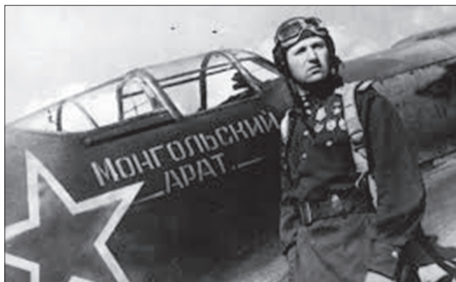
“Монгол ард” нисэх эскадрилийн онгоц

Монголын ард түмнээс Зөвлөлтийн Улаан армид бэлэглэсэн бас нэг байлдааны техник бол “Монгол ард” нисэх онгоцны эскадриль билээ. “Монгол ард” эскадрилийг байгуулах тухай шийдвэрийг 1943 оны 3 дугаар сард болсон Улсын Бага хурлын 26 дугаар хуралдаанаас гаргаж хэрэгжүүлсэн юм. Монголын ард түмэн “Фронтод зориулан байлдааны нисэх онгоцны эскадрилийг хурдан шуурхай байгууль”