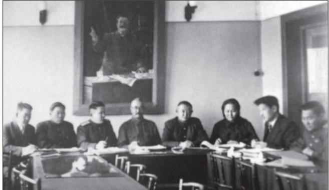
МАХН-ын Төв Хорооны Тэргүүлэгчид, БНМАУ-ын Бага Хурлын Тэргүүлэгчид, Ардын Сайд нарын Зөвлөлийн хамтарсан хурал

Монголын төр, засаг, ард түмэн өөрийн эх орны хөгжил, дэвшил, тусгаар тогтнолыг Зөвлөлт Холбоот Улстай шууд холбон үзэж байсны хувьд дайн эхэлсэн өдрөөс Гитлерийн Германы эсрэг Зөвлөлтийн ард түмний хийж буй ариун тэмцэлд нэгдэн орсон юм. Зөвлөлтийн ард түмний Аугаа Эх орны дайн эхэлсэн тэр өдөр БНМАУ-ын Бага Хурлын Тэргүүлэгчид, МАХН-ын Төв Хорооны Тэргүүлэгчид, Ардын Сайд нарын Зөвлөлийн хамтарсан хурал болж ЗХУ-д Гитлерийн