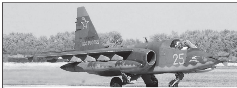
Монгол Ард 2 дугаар эскадрилийн Дайрагч Су-25 /ОХУ, Чита хот, аэродром Домна/

Тус хороо (3 эскадрильтэй)-ны зэвсэглэлд Су-30М, Су-34, Су-25