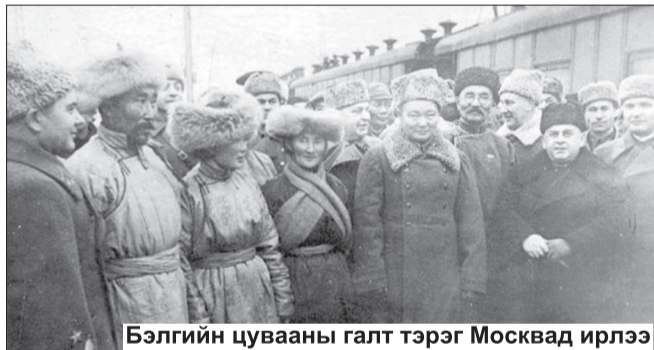
Бэлгийн цувааны галт тэрэг Москвад ирлээ

1942 онд Октябрийн хувьсгалын 25 жилийн ойг тохиолдуулан бэлгийн гурав дахь цувааг мөн оны 11 дүгээр сарын 27-ны өдөр Наушкаас хөдөлгөн БНМАУ-ын Ерөнхий сайд маршал Х.Чойбалсангийн ахалсан нам, улс, олон нийтийн байгууллагын зүтгэлтэн, аж үйлдвэр, соёл, шинжлэх ухааны 40-өөд ажилчин, ажилтнаас бүрдсэн томоохон бүрэлдэхүүн хүргэжээ. Монголын ард түмний чин сэтгэл, цаг наргүй хөдөлмөрөөр бүтсэн нийт 236 вагон тэрхүү бэлгийн зүйлст: богино нэхий дээл 30115, эсгий гутал 30500 хос, үстэй бээлий 31257, үстэй хантааз 31090, цэрэг бүс 33300, ноосон цамц 2290, нэхий хөнжил 2011, дах 3050, эсгий гэр 150, гэрийн эсгий 2428, бусад гутал (үстэй сөөхий, цагаан ултай) 2575 хос, эмнэлгийн шаахай 7158 хос, казах эмээл 600, мах 316 тонн, зээрийн мах 26758 ширхэг, тос 92 тонн, хиам 84,8