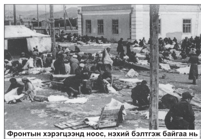
Фронтын хэрэгцээнд ноос, нэхий бэлтгэж байгаа нь

Дайны бүх жилүүдийн турш Монголоос бас нэг стратегийн бараа нийлүүлж байсан нь ноос. Ноос нь юуны өмнө цэргийн шинель болдог байсан бөгөөд тэр үед манай улс 64 мянган тонн ноос нийлүүлсэн юм. 1942-1945 онд Зөвлөлтийн цэргийн таван шинель бүрийн нэг нь Монголын ноосоор хийсэн байлаа. Монгол Улс цэргийн үстэй дээл, үстэй малгай, бээлий, эсгий гутлыг дайны анхны жилийн намар нийлүүлж эхэлсэн. 1941 оны 11 дүгээр сарын эхээр Москвагийн дэргэдэх сөрөг тулалдаанд бэлтгэхэд Зөвлөлтийн явган цэргийн хэд хэдэн дивизийн цэргүүдийг манай оёдолчдын өбсөн өвлийн хувцсаар бүрэн хангасан байсан. Дайны жилүүдэд ЗХУ-д олдож байсан гянт болдын цорын ганц үйлдвэрлэлийн ач холбогдол