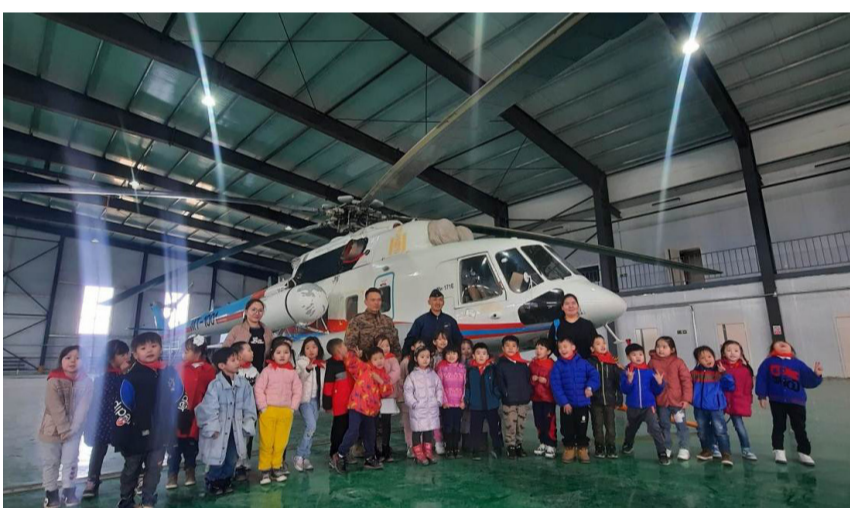
Зэвсэгт хүчний 303 харилцааг бэхжүүлэх ажлын дугаар анги нь иргэн цэргийн хүрээнд Хан-Уул дүүргийн 21

дүгээр хороонд байрлах "Соньхон ертөнц" цэцэрлэгийн багш ажилчид болон дунд бүлгийн хүүхэд багачуудад ангийн өдөр тутмын үйл ажиллагааг танилцуулах нээлттэй хаалганы өдөрлөгийг зохион байгууллаа.