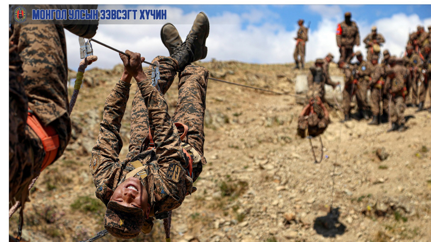
Гэрэл зураг-нэг агшин

Ташрамд дуулгахад Монгол Улс 1936 оны 3 дугаар сарын 6-ны өдөр анх удаа хурандаа цолыг олгосон бөгөөд үүнээс хойш Батлан хамгаалах салбар, Зэвсэгт хүчний түүхэнд 3000 гаруй хурандаа цолтон төрөн гарч эх орон, ард түмнээ сахин хамгаалах үйл хэрэгт үнэтэй хувь нэмэр оруулсаар иржээ.