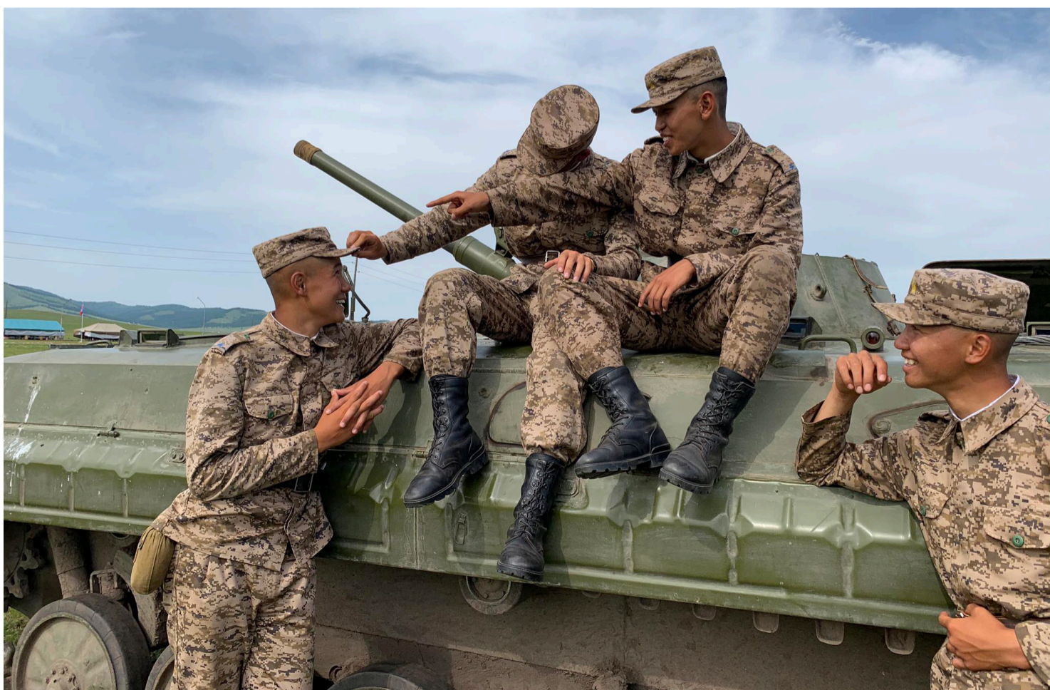
ЦЭРГИЙН НӨХӨРЛӨЛ НАСАН ТУРШИЙНХ БАЙДАГ