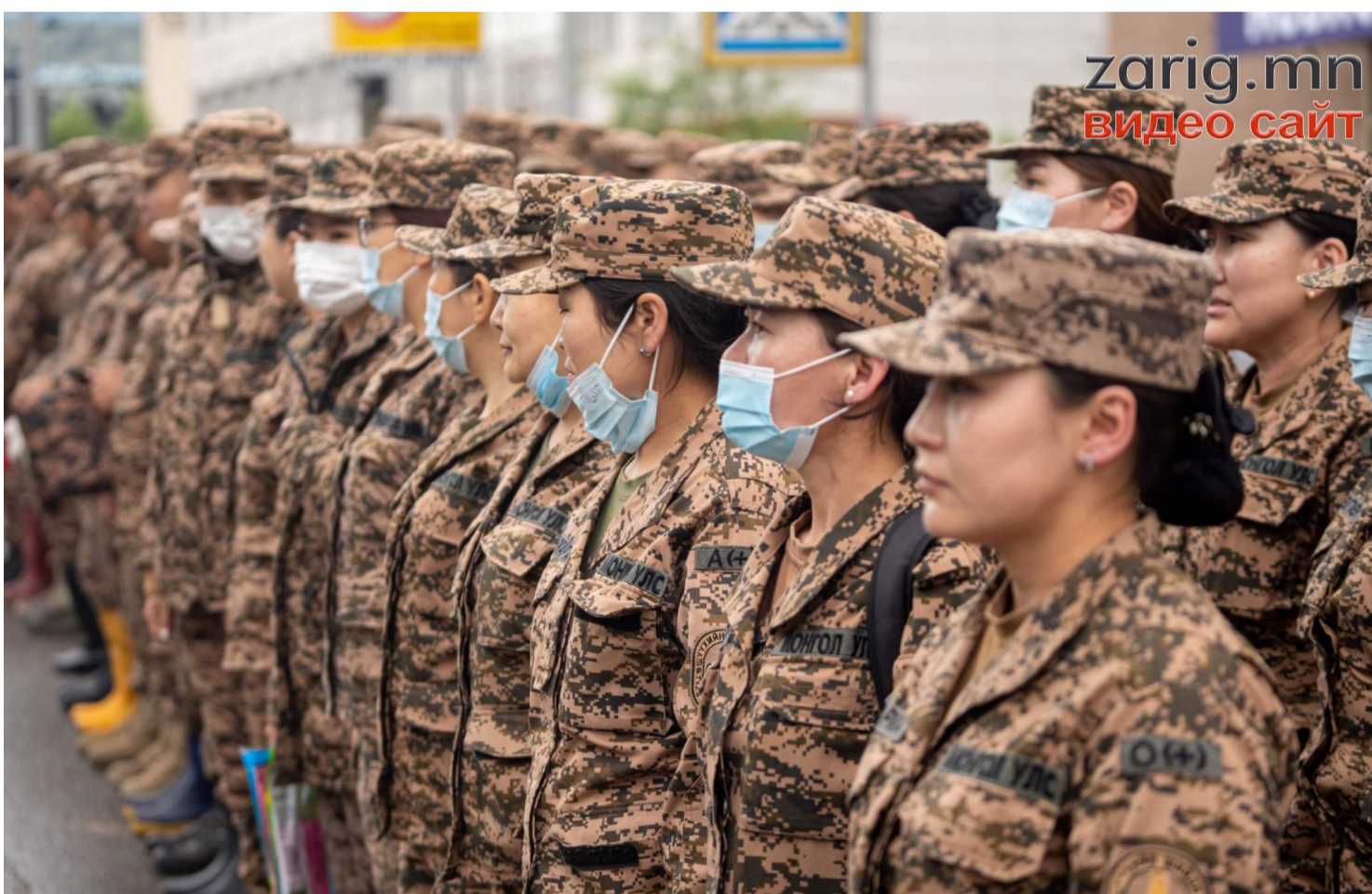
Үерийн голомтод үүрэг гүйцэтгэж буй цэргийн бүсгүйчүүд