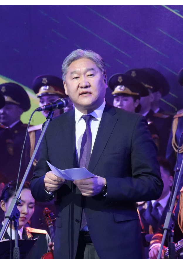
дивизион гээд 1000-аад цэрэгтэй атлаа

Монгол Улсын Ерөнхийлөгч, Зэвсэгт хүчний командлагч У.Хүрэлсүх бид хоёр онжавууд юм л даа. 2019 оны 5 дугаар сард тэрбээр Ерөнхий сайд байхдаа Монголын жагсаалын дарга нар буюу Жа нарын холбоо гэж байж болох талаар саналаа хэлж, ажил хэрэг болгоод, үйл ажиллагааг нь жигдрүүлэх чиглэл өгсөн. Миний бие тухайн үед Нийслэлийн иргэдийн төлөөлөгчдийн хурлын дарга байлаа. Гурван жилийн албыг жагсаалын дарга, ахлах түрүүч цолтой хаасны хувьд “Мэдлээ, гүйцэтгээ” гээд л ажилдаа орсон доо. Тэгээд хамгийн түрүүнд хамт алба хааж байсан Ховдын хорооны нөхдөө дуудаж цуглуулсан. Ингээд холбооны маань үйл ажиллагаа жилээс жилд өргөжин тэлсээр өнөөдөр 21 аймаг, 9 дүүрэгт салбартай, 17 мянга орчим гишүүнтэй нийгэмд үйлчилдэг төрийн бус байгууллага боллоо. Жагсаалын дарга гэхээр бас цагаа тулахаар цөөхөн байсан. Манай Ховдын хороо гэхэд л мотобудлагын гурван батальон, их бууны