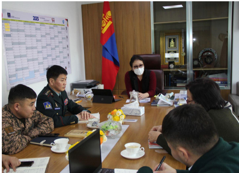
Хөдөлмөр, нийгмийн хамгааллын сайд, Батлан хамгаалахын сайд нарын хамтарсан 2020 оны А/70-А/58 дугаар тушаалаар батлагдсан "Цэргийн алба хаагчдад мэргэжил, ур

чадвар эзэмшүүлэх сургалт зохион байгуулах журам"-ын хүрээнд хугацаат цэргийн алба хаагчдад барилгын өргөн мэргэжил олгох сургалтыг 2022 оны 01 дүгээр сарын 16-ны өдрөөс зохион байгуулахаар шийдвэрлээд байна.