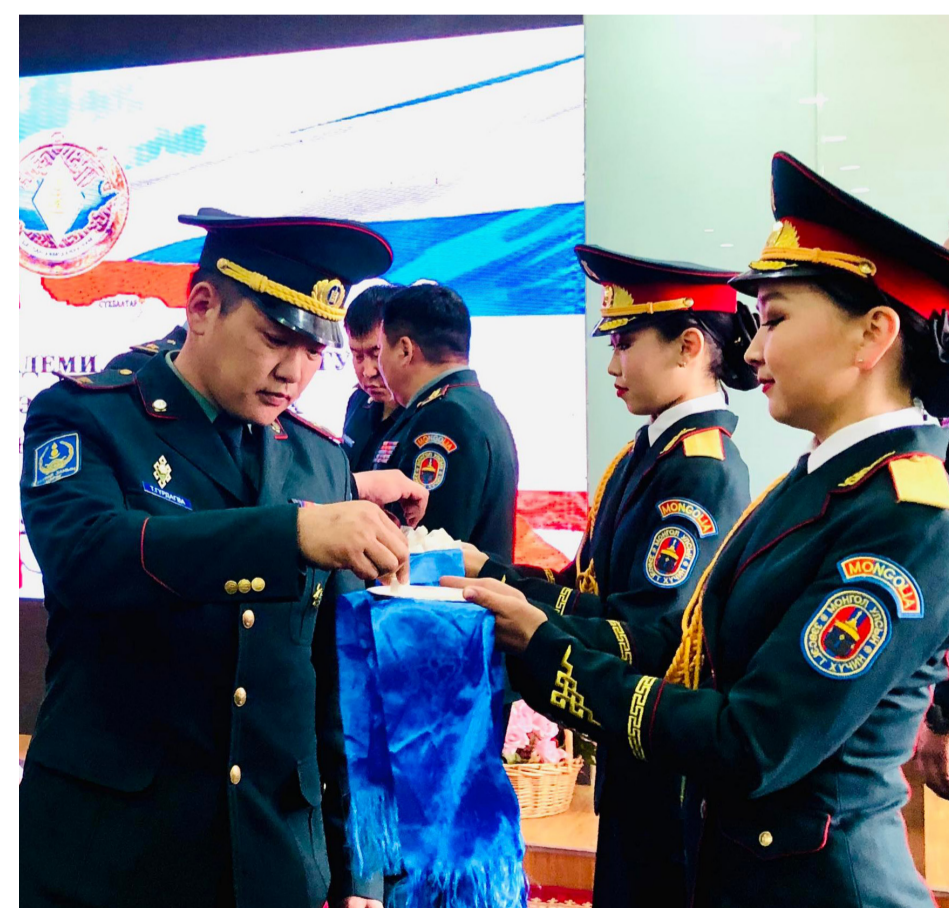
ОХУ-ын Цэргийн академи, Их, Дээд сургуульд суралцах бүрэлдэхүүнийг үдэх ёслолын ажиллагааны үеэр

ЗХЖШ-ЫН АУГ-ЫН ЭНХИЙГ ДЭМЖИХ АЖИЛЛАГААНЫ ХЭЛТЭС