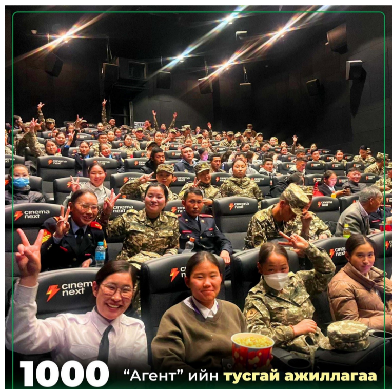
1000 "Агент" ийн тусгай ажиллагаа

ҮБХИС-ийн нийт 870 гаруй бие бүрэлдэхүүн (Багш, албан хаагч, оюутан, сонсогч, хугацаат цэргийн албан хаагч) оролцож нэгэн өдрийг дурсамж дүүрэн хайртай жүжигчидтэйгээ ярилцлага хийн зураг даруулж чадварлаг жүжигчид хамт олонтой "Цурам ажиллагаа" киногоо шимтэн шимтэн үзлээ.