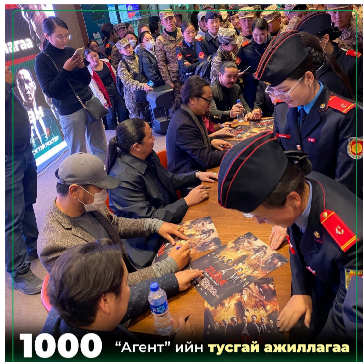
1000 "Агент" ийн тусгай ажиллагаа

Үндэсний батлан хамгаалах их сургууль болон Cinemanext кино театр, Fantastic Production хамтын үйл ажиллагааны хүрээнд 2022.10.05-ны өдөр зохион байгуулсан ZURA "Цурам ажиллагаа" 1000 "Агент"-ийн тусгай ажиллагаа амжилттай болж өндөрлөлөө.