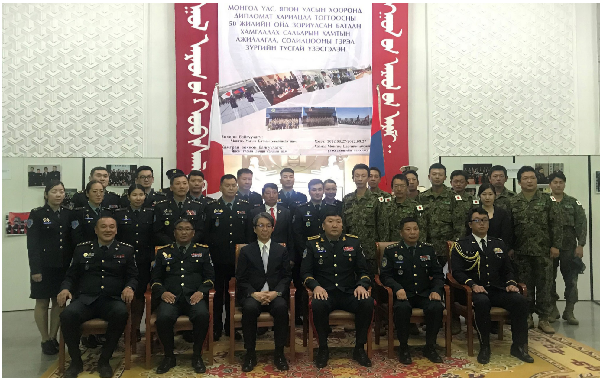
МОНГОЛ УЛС, ЯПОН УЛСЫН ХООРОНД ДИПЛОМАТ ХАРИАЦАА ТОГТООСНЫ 50 ЖИЛИЙН ОЙД ЗОРИУЛСАН БАТЛАН ХАМГААЛАХ САЛБАРЫН ХАМТЫН АЖИЛЛАГАА, СОЛИЛЦООНЫ ГЭРЭЛ ЗУРГИЙН ТУСГАЙ ҮЗЭСГЭЛЭН