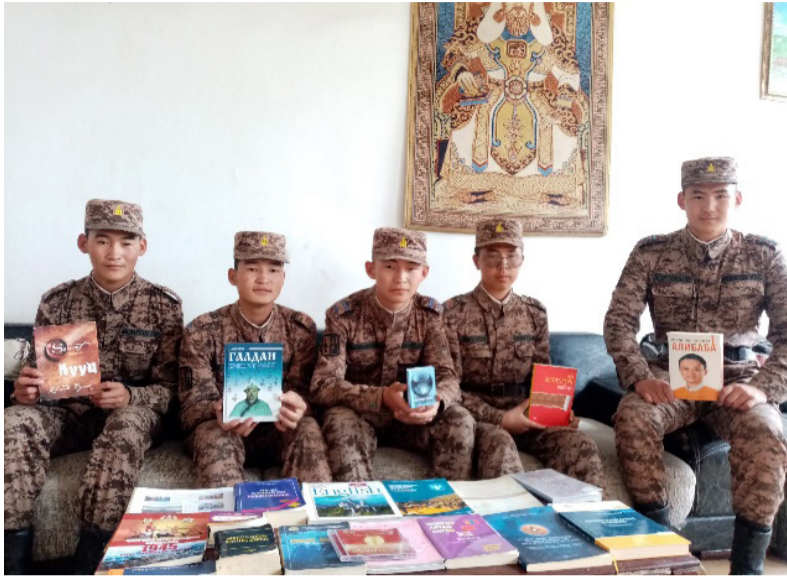
Зэвсэгт хүчний 013 дугаар анги

Хугацаат цэргийн алба хаагчдын чөлөөт цагийг зөв боловсон өнгөрүүлэх, тэдний оюуны цангааг тайлж, царааг нь тэлэх үүднээс "7 хоногт нэг ном" аяныг өрнүүлж эхэллээ. Энэ хүрээнд дайчид 7 хоног бүрийн төгсгөлд уншсан номынхоо талаар бусадтайгаа хуваалцаж, мэдлэг мэдээллээ солилцох юм. Эл боломжийг бүрдүүлэх үүднээс ангийн номын сангаас гадна рот, салбартаа номын буланг нээн ажиллуулж байна. Уг аяныг өрнүүлж буйд байлдагч нар сэтгэл өндөр байгаа бөгөөд уншсан номынхоо тухай тэмдэглэлийг хөтлөх дэвтр захиад амжсан байлдагч