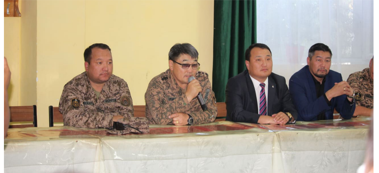
Зэвсэгт хүчний 338 дугаар анги

Нийслэлийн Чингэлтэй дүүргийн Засаг даргын Тамгын газар болон Цэргийн штабын төлөөлөл, Сүхбаатар аймгийн ЗДТГ-ын Цэргийн штабын удирдлага Чингэлтэй дүүргээс хугацаат цэргийн албанд татагдан тус ангид алба хааж буй дайчдыг эргэлээ.