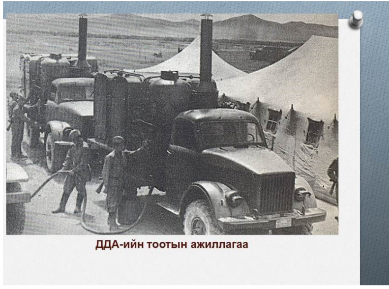
ДДА-ийн тоотын ажиллагаа