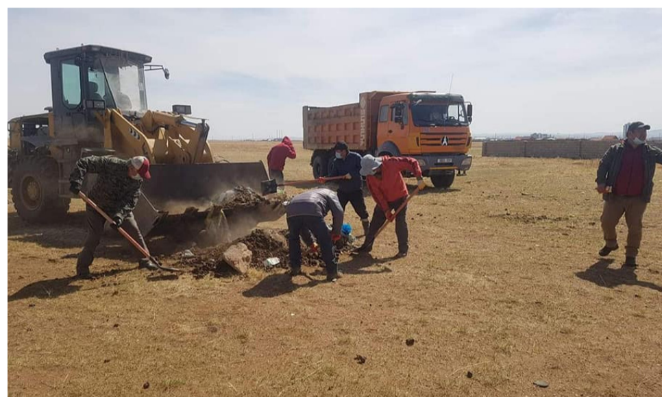
Хэнтий аймгийн ЗДТГ-ын Цэргийн штаб

Хэнтий аймагт коронавируст цар тахал /Covid-19/-ын халдварын голомт үүсэж өвчлөл нэмэгдсэнтэй холбогдуулан аймгийн Онцгой комиссоос гарсан Гамшгаас хамгаалах бүх нийтийн бэлэн байдлын зэрэг шилжүүлэх, хорио цээрийн дэглэмд шилжүүлэх тухай шийдвэрийг хэрэгжүүлэх үүднээс цэргийн албыг биеэр дүйцүүлэн хаагчид Онцгой байдлын газар, Цагдаагийн алба хаагчидтай хамтран 4 дүгээр 16-ны