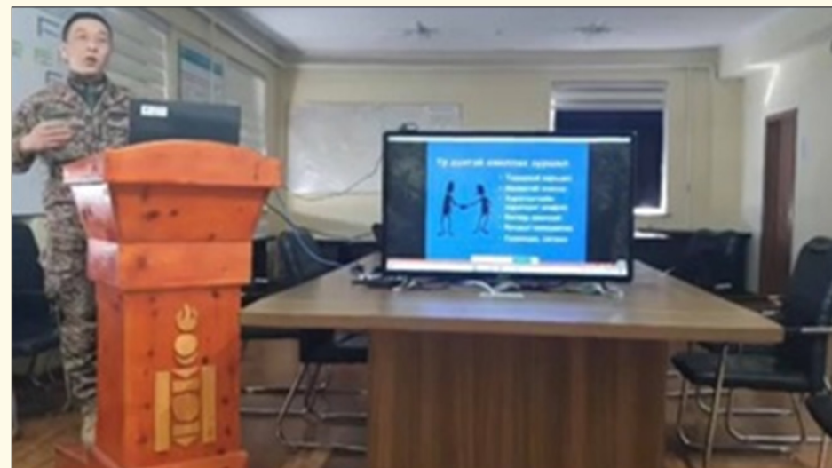
Зэвсэгт хүчний 331 дүгээр анги

Хүний эрхийн үндэсний комиссын Баян-Өлгий аймаг дахь салбартай хамтран "Хүний эрхэд суурилсан хандлага" сэдвээр цахим сургалтыг явууллаа.