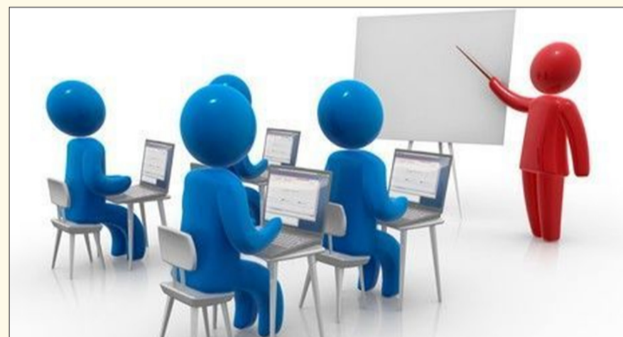
Зэвсэгт хүчний 284 дүгээр анги

Тус ангийн сэтгэл зүйн хангалтын офицер, ахлах дэслэгч М.Очгэрэл "Харилцааны сэтгэл зүйн зарим асуудал" сэдвээр цахим сургалтыг бие бүрэлдэхүүнд энэ сарын 19-нд явууллаа.