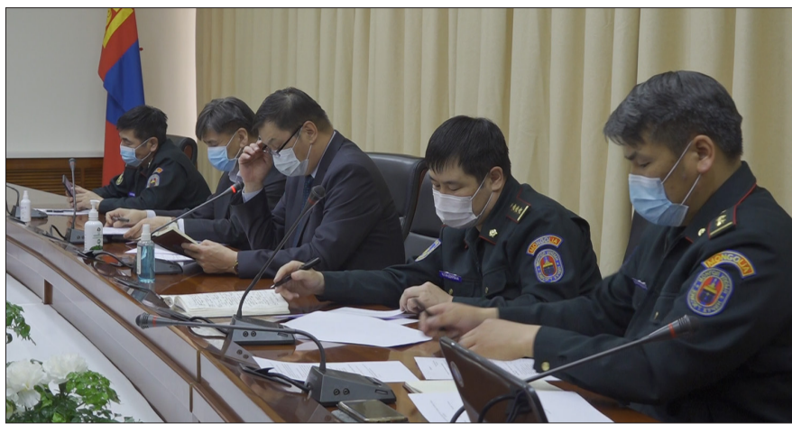
Батлан хамгаалах бодлого, зорилт түүний хэрэгжилт, Зэвсэгт хүчний үйл ажиллагааг дээшлүүлэхэд чухал хөшүүрэг болох аж.

Хуралдаанаар Иргэний зөвлөлийн үйл ажиллагааны журмын төслийг хэлэлцэн ажлын хэсгүүдийн дарга, гишүүдийн нэгдсэн саналаар дахин боловсруулахаар болсон юм. Энхээр журмын төсөл батлагдсанаар Зэвсэгт хүчинд тавих иргэний хяналт сайжирч, Зэвсэгт хүчний үйл ажиллагаанд олон нийтийн оролцоо нэмэгдэх төдийгүй төрийн батлан хамгаалах үйлчилгээ, төрийн захиргааны байгууллагаас шийдвэр гаргах үйл ажиллагаанд иргэдийн төлөөллийн оролцоог нэмэгдүүлэх боломж нэмэгдэх давуу талтай юм. Эдгээр нь