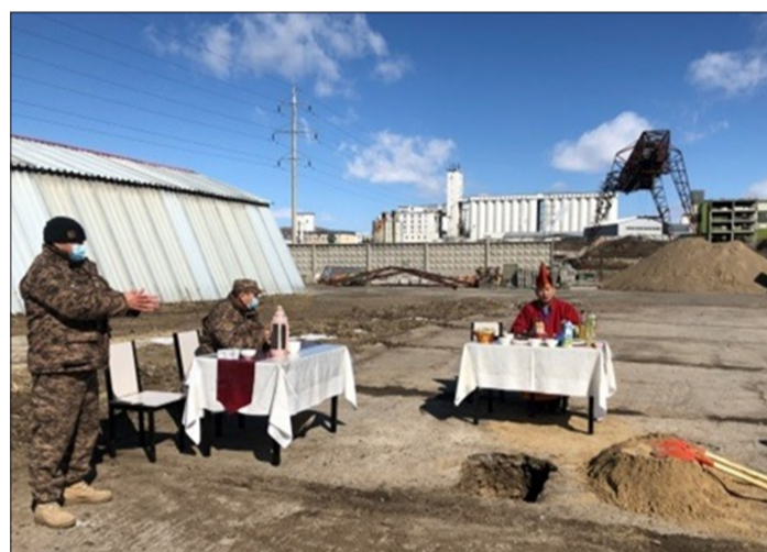
Зэвсэгт хүчний 017 дугаар анги

Цэргийн байрны шав тавих ёслол боллоо. Ёслолын ажиллагаанд ангийн удирдлага, бие бүрэлдэхүүн оролцсон. Мөн Дашчаглин хийдийн