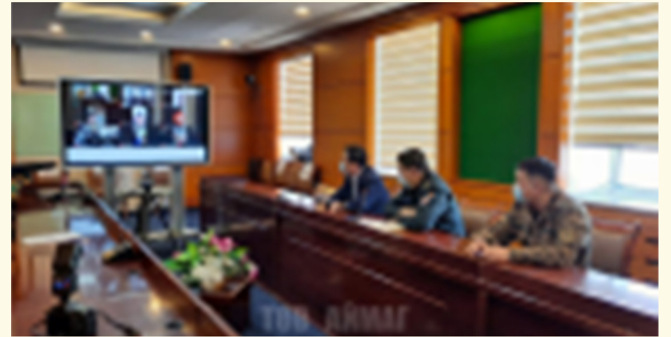
Төв аймгийн ЗДТГ-ын Цэргийн штаб

Тус Цэргийн штаб Зэвсэгт хүчний 016 дугаар нэгтгэлд 2020 оны хоёрдугаар ээлжээр цэргийн албанд татагдсан дайчдыг цахимаар болон утсан холбоогоор аав ээж, ах дүү нартай нь холбох ажлыг хамтран явуулав. Тусээлжийн цэрэг татлагаар Төв аймгийн Зуунмод, Архуст, Баянчандмань, Батсүмбэр, Борнуур, Батсүмбэр, Баянжаргалант, Мөнгөнморьт, Эрдэнэ зэрэг сумаас цэргийн албанд татагдсан дайчид цахим болон үүрэн холбоогоор холбогдсон юм.