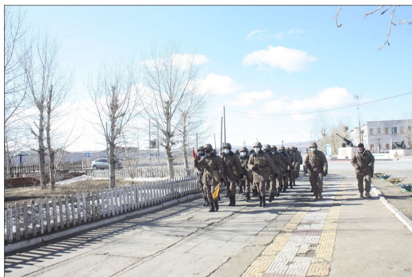
Зэвсэгт хүчний 120 дугаар анги

2020-2021 оны сургуулийн жилийн сургалтын төлөвлөгөөний хэрэгжилт болон салбаруудын жигдрэлтийг хангах, бие бүрэлдэхүүнд бие бялдар, сэтгэл зүйн бэлтгэлжилтийг хангах зорилгоор ангийн байнгын байрлал, буудлагын талбай, Бөхөг цагаан толгой, Нэргүй өндөрлөг, Ангийн байнгын байрлал гэсэн маршрутаар тактик тусгай бэлтгэлийн 15 км-ийн явган маршийг энэ сарын 16-нд явууллаа.