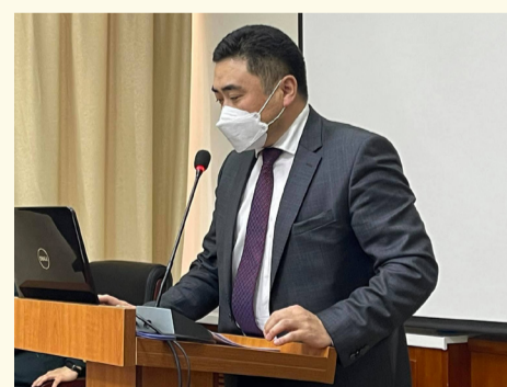
Ургэлжлэл нь арын нүүрт!

ЕТГ, ЯАБЗ, БХЯ, БШУЯ, ХНХЯ, ЗХЖШ, ХХЕГ, ЦЕГ, ОБЕГ, ШШГЕГ, ТЕГ, ТТХГ-аас удирдах албан тушаалтнууд багтсан юм.