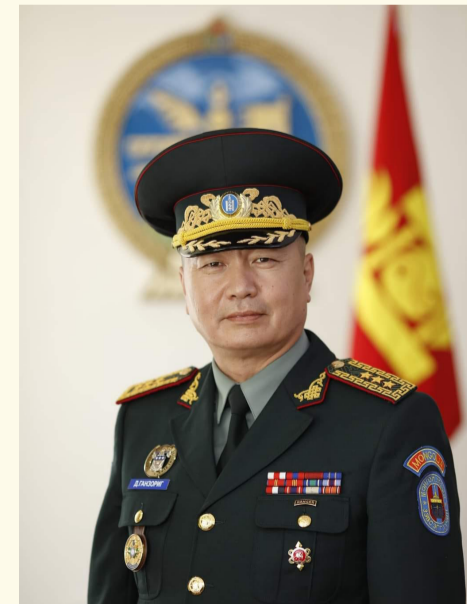
сонсогч, сурагч, түрүүч байлдагч нарт дахин баярын мэндийг дэвшүүлж, ажлын арвин их амжилт, амьдралын сайн сайхан бүхнийг бэлгэдэн ерөөе.

Энэхүү түүхт 100 жилийн ойг тохиолдуулан бэлтгэл болон чөлөөнд байгаа ахмад дайчид, тус сургуульд ажиллаж байсан болон өдгөө ажиллаж буй генерал, офицер, ахлагч, ажилчин албан хаагч,