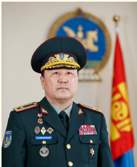
Монгол Улсын шинэ цагийн боловсролын эхлэлийг тавилцсан ууган их сургуулиудын нэг Сүхбаатарын болон Байлдааны гавьяаны улаан тугийн

одонт, жанжин Д.Сүхбаатарын нэрэмжит Үндэсний батлан хамгаалахын их сургууль үүсэн байгуулагдсаны түүхт 100 жилийн ойн баярын мэндийг тус сургуулийн үе үеийн удирдлага, эрдэмтэн багш, судлаачид, ажилтан албан хаагчид, нийт төгсөгчид Та бүхэндээ өргөн дэвшүүлж!