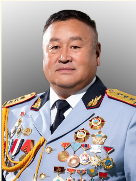
амжилт бүтээлээр дүүрэн дэвшиж, эрүүл энх, саруул сайхан байхыг хүсэн ерөөе.

“Таван толгой”-чууд бидний ажил үйлс 35 жилд хөгжин дэвшсээр ирсэн, өнөөдөр ч ундарч, цаашдаа ч улам боловсронгуй болж хөгжсөөр байх болно. Зэвсэгт хүчний 311 дүгээр ангийн 35 жилийн ойн баярын мэндийг дахин хүргэж ажил, амьдрал нь