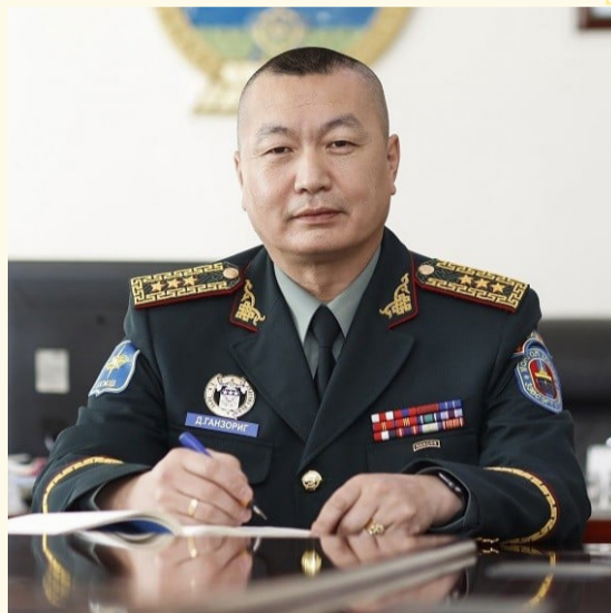
Монгол цэргийн яруу алдар, сүр хүч, сүлд хийморь мандан бадрах болтугай!

Энэхүү түүхт ойг тохиолдуулан бэлтгэл болон чөлөөнд байгаа ахмад дайчид, тус ангид ажиллаж байсан, өдгөө ажиллаж буй офицер, ахлагч, түрүүч, байлдагч нар, ажилтан албан хаагчдаа дахин баярын мэндчилгээг дэвшүүлж, ажлын арвин их амжилт, амьдралын сайн сайхан бүхнийг бэлгэдэн ерөөе.