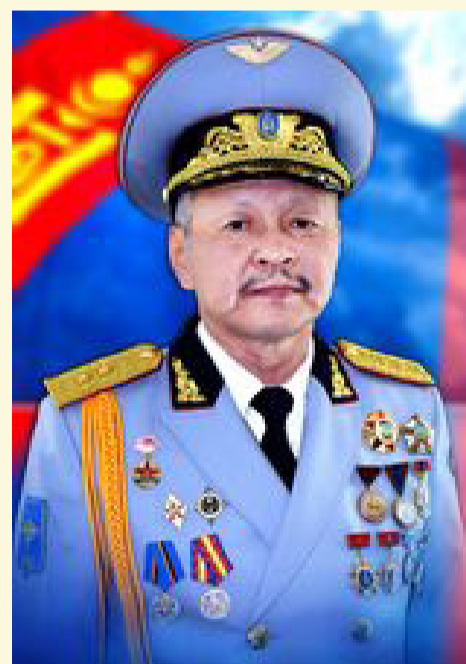
ЗЭВСЭГТ ХҮЧНИЙ ЖАНЖИН ШТАБЫН ДАРГА ДЭСЛЭГЧ ГЕНЕРАЛ Д.ГАНЗОРИГ

Эх орныхоо цэлмэг хөх тэнгэрийг тольдон харж, сахин хамгаалах агаарын харуулчдын бахдам сайхан албыг үргэлжлүүлж байгаа Зэвсэгт хүчний Агаарын цэргийн нийт бие бүрэлдэхүүнд болон Агаарын довтолгооноос хамгаалах цэргийн хөгжил дэвшил, хойч үеийнхээ ирээдүй, тэднийг сурган хүмүүжүүлэх ажилд хөдөлмөрлөн зүтгэж ирсэн ахмад буурлууд Та бүхэндээ Улсыг агаарын довтолгооноос хамгаалах цэргийн 57 жилийн ойн