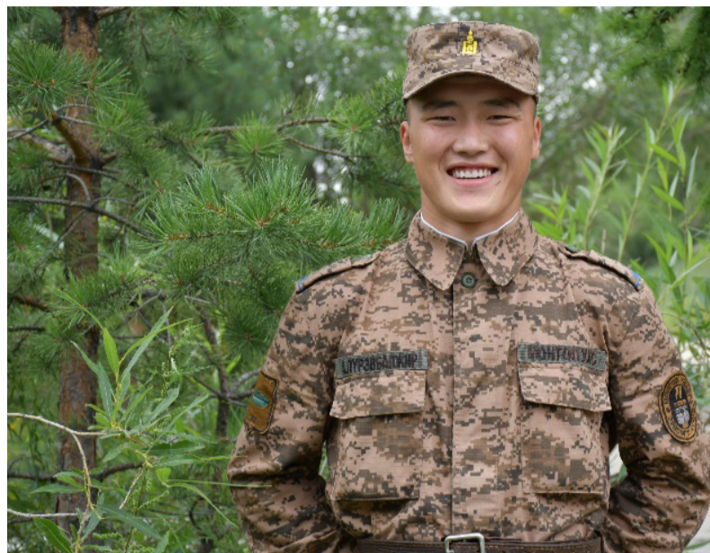
Зэвсэгт хүчний 186 дугаар анги

Би Архангай аймгийн Хайрхан сумаас 2020 оны II ээлжийн цэрэг татлагаар Зэвсэгт хүчний 186 дугаар ангид хугацаат цэргийн албыг хаахаар ирсэн. Цэргийн