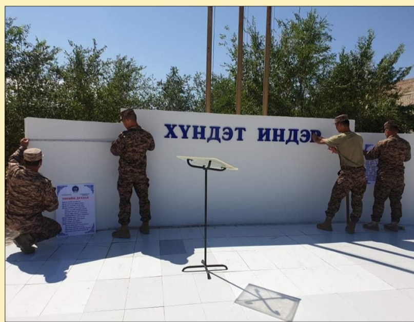
журамтай, сахилга баттай, хэрхэн чанартай хийж, цаг гар нийлэмжтэй ажиллаж, хугацаанд нь гүйцэтгэдгийг өгсөн үүрэг даалгаврыг илтгэж байгаа юм.

Тус ажлын хүрээнд хорооны жагсаалын талбайн индрийг бүрэн засварлаж, биеийн тамир спортын гаднах талбайн өнгө үзэмжийг сайжруулж, зориулалтын дагуу дахин төхөөрөмжиллөө. Энэхүү бүтээлч ажил нь ахлагчийн алба нэг хүсэл зорилгод чиглэн ажиллаж, бие бүрэлдэхүүнийг нэгдсэн удирдлага, зохион байгуулалтад оруулан эмх