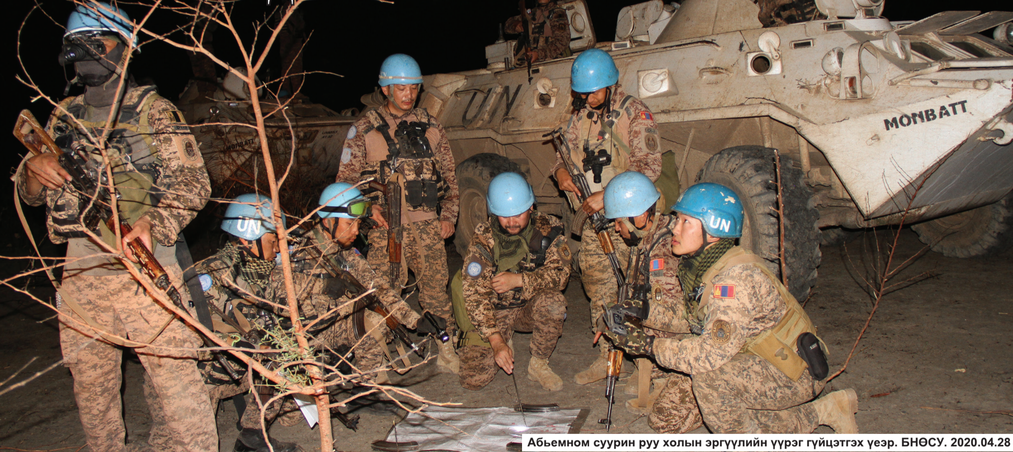
Абьёмном суурин руу холын эргүүлийн үүрэг гүйцэтгэх үеэр. БНӨСУ. 2020.04.28