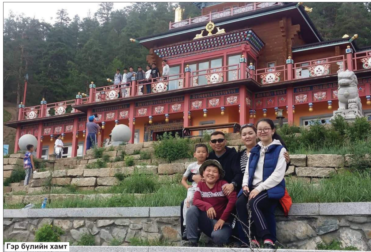
Гэр бүлийн хамт

пулемётчин, тасгийн захирагч, салааны захирагчийн орлогч, тэгээд одоогийн албан тушаалд томилогдон ажиллаж байна.