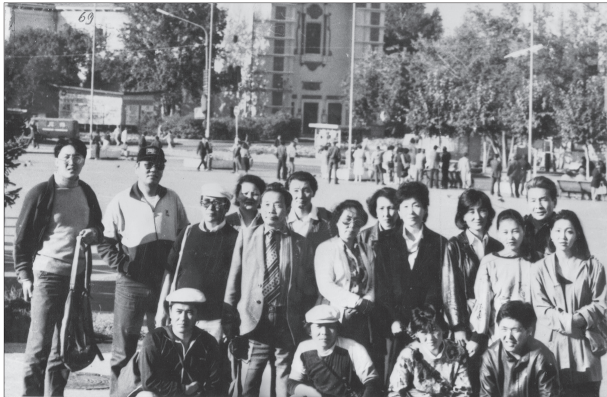
“Улаан од”-ынхон редакцияраа Улан-Үдэ хотод зочилсон нь. 1990 он

учраас тэр. Бусдын таашаалд нийцүүлж бичих, хэн нэгэнд долгигонож бялдуучлан бусдын үг, зааврыг биелүүлэн бичлэгтээ тусгах, захиалгаар бичих зэрэг нь сэтгүүлч хүний хувьд мөхөл юм. Ийм мөхлийн эсрэг дархлаа нь ердөө л үнэнийг бичих. Т.Ганди бид хоёрыг уншигчид сэтгүүлч гэж нэрлэдэг юм. Үнэнийг л бичдэг учраас тэр л дээ.