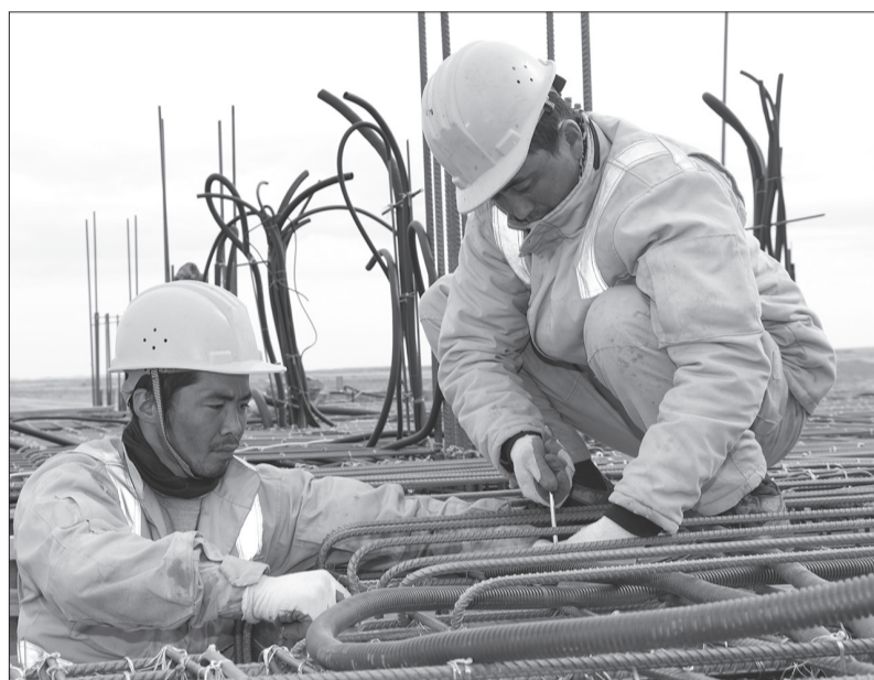
Төмөр замын зөрлөгийн барилгын ажлын явцаас ...

нь зүйн хэрэг. Тэд үүрийн гэгээнээс үдшийн бүрий хүртэл ажиллана. Ихэнхдээ магтаал, сайшаалын ард нь хоцорч үлддэг ч ажлаа хийсээр л байдаг. Тэднээр бахархахгүй байхын аргагүй хөдөлмөрч