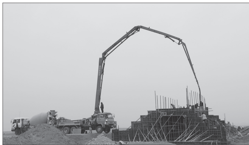
Ус зайлуулах хоолойны ажил ид үргэлжилж байна