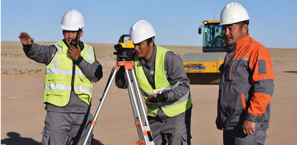
(Энэ тухай сурвалжилгыг III нүүрнээс уншина уу)