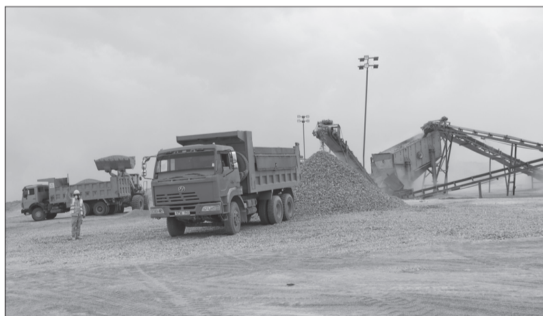
Чулуу бутлуурын үйлдвэрт ажлын бүтээмж өндөр