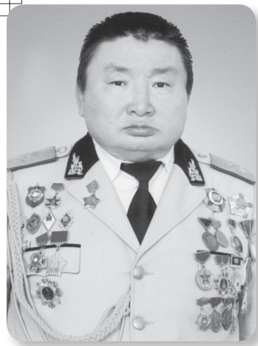
хамгаалах үйлсэд манлайлан оролцож, үе үеийн эх орончдыг төлөвшүүлэхэд оюун ухаан, хүч хөдөлмөрөө зориулж ирсэн билээ.

Өнөөдөр ч нийгмийн шинэ тогтолцооны алдаа, оноотой цаг үеийн дэнсанд иргэдийн оюун санаа, нэн ялангуяа цэргийн алба хаагчдын итгэл үнэмшил, сэтгэл зүйн бат тогтвортой байдлыг хангахад цэргийн улс төр, соёл хүмүүжлийн ажилтнуудын мэдлэг, мэргэжил, дадлага, туршлага улам бүр өндөр ач холбогдолтой онцлон тэмдэглэе.