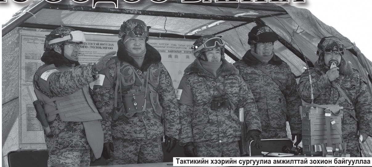
Тактикийн хээрийн сургуулиа амжилттай зохион байгууллаа

Ангиас тодорхой тооны бие бүрэлдэхүүн төмөр замын бүтээн байгуулалтын ажилд оролцож байгаа ч сургуулийн жилийн нэгдүгээр үеийн цэргийн сургалт бэлтгэл, хээрийн гаралт, тактикийн хээрийн сургуулийг төлөвлөгөөний дагуу амжилттай зохион байгуулж, төгсгөлд нь ангийн захирагчийн нэрэмжит шалгалт, цэргийн мэргэжлийн зэргийн шалгалтыг явуулсан. Бие бүрэлдэхүүн бүтээн байгуулалтын ажилд оролцохоос гадна төлөвлөгөөт сургалт, дадлауудыг