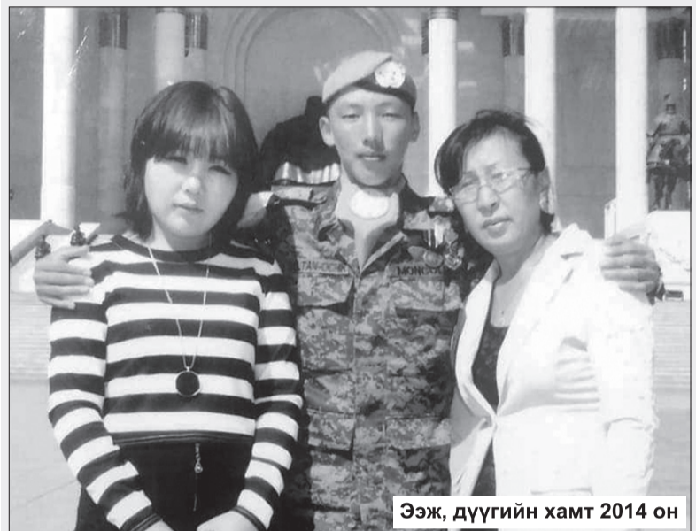
Ээж, дүүгийн хамт 2014 он