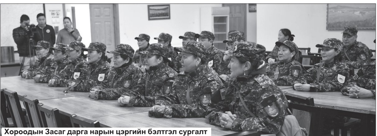
Хороодын Засаг дарга нарын цэргийн бэлтгэл сургалт