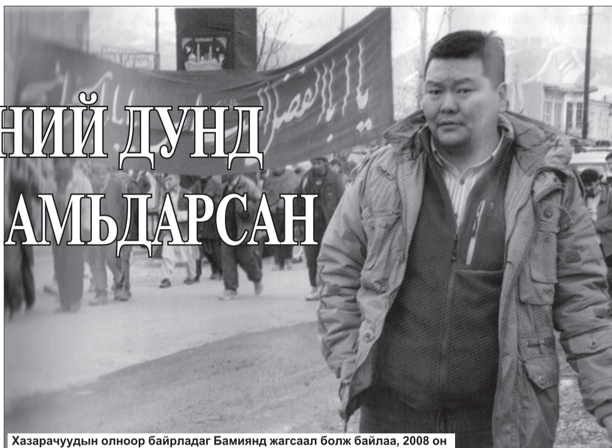
Хазарачуудын олноор байрладаг Бамиянд жагсаал болж байлаа, 2008 он