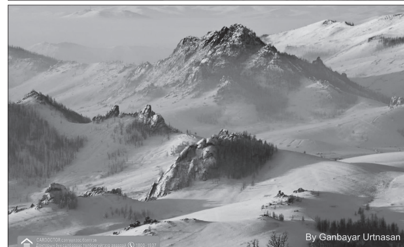
By Ganbayar Urtnasan

“Хүрээлэн” төслийн хүрээнд авагдсан зургууд