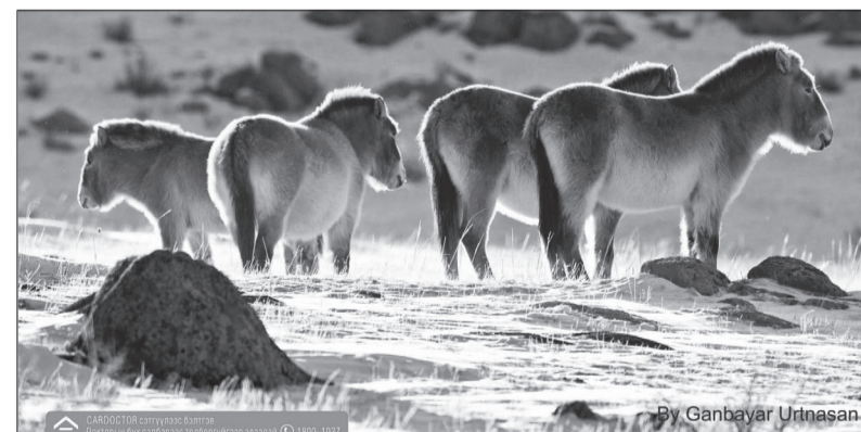
By Ganbayar Urtnasan