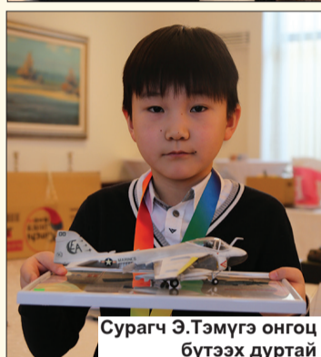
Сурагч Э.Тэмүгэ онгоц бүтээх дуртай