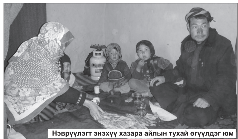
Нэвтрүүлэгт энэхүү хазара айлын тухай өгүүлдэг юм

зорьж ирсэн хазара ард түмний анхны төлөөлөгч нь тэр. Хазара түмний талаар олж авсан хамгийн анхны мэдээлэл нь үндэсний цөөнх, бас шашны цөөнх гэдэг мэдээ. Афганистаны 40 хувь нь паштун, 25 хувь нь тажик, 20 хувь нь хазара, зургаан хувь нь узбек, үлдсэн хэсэг нь олон отог омгийн үндэстэн байдаг тухай Хуссейн бидэнд танилцууллаа. Харин шашны тухайд Афганистаны 84 хувь нь исламын шашин, 15 хувь нь шиа буюу шийт урсгалыг дагадаг гэнэ.