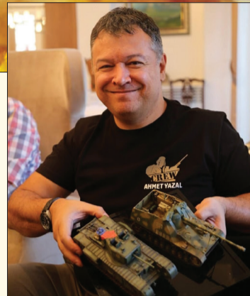
БНТУ-аас Монгол Улсад суугаа Онц бөгөөд Бүрэн эрхт Элчин сайд Ахмад Язал